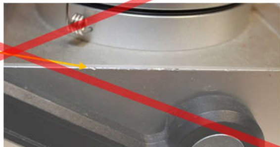
Bild 4: unnötige Beschädigung der Seitenwand durch fehlende Abpolsterung beim Transport